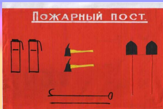
«Пожарный пост» семья Киселёвых